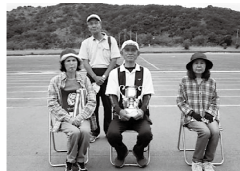
1位・2位をみの集合写真