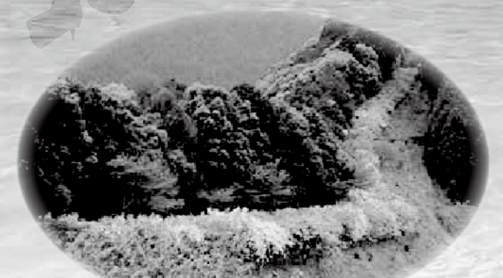
日本一長い藤棚ロード(1,646m) (みやまの里森林公園内)

制限時間内に、定められたエリア内で拾ったゴミの量と質でポイントを競い合う、子供から大人まで年齢を問わずにできる「スポGOMI」。楽しくゴミを拾い、一緒に街をきれいにしませんか?