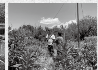
畑で草刈りの様子も

まことフィッシング：まことフィッシング:日高川町の皆様～もう「BSよしもと」ご覧いただけましたか? 和佐の畑が映りましたよ!!僕たちが、八朔の木に肥料を撒いているシーンがばっちり全国に流れました。どんなテレビ番組やねん(笑)とツッコミたくなと思いますが、少しでも日高川町の若手農家さんと、わんだーらんどを取り組みを知ってもらえるいい機会になったはずです。発信を続ける中で、最近やっと、移住に興味があるという連絡も他府県からいただけるようになりました。まだ、住みますという方はいらっしゃいませんが安心して下さい。見つからなかったときは、相方が住みます(笑)