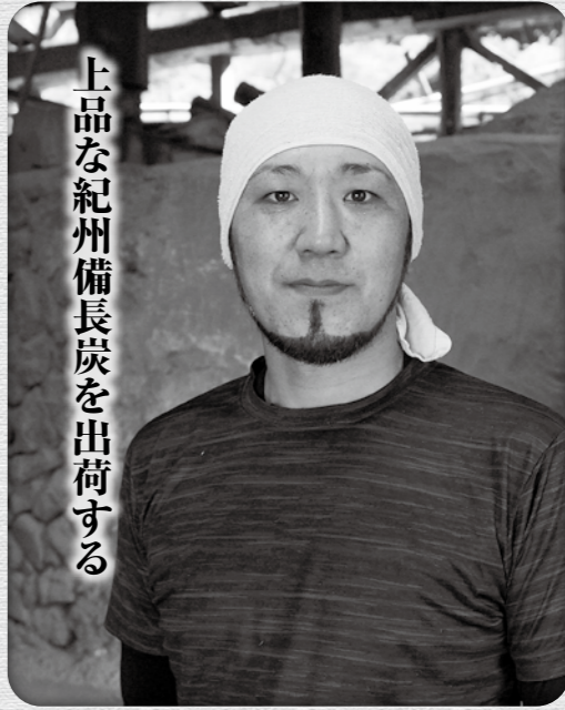
上品な紀州備長炭を出荷する