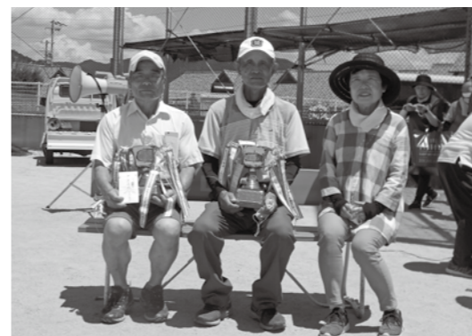
優勝準優勝者のみの集合写真