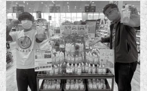
わんだーらんども店頭にて販売

まことフィッシング：皆様～新年明けましておめでとうございます!! 今年もよろしくお祈りします～そろそろ、わんだーらんどが管理する畑では甘夏とハッサクの収穫が始まります。その前に、去年収穫し、果汁を搾りジュレにした『イジュ～レ』を販売し、メッサオークワ岩出店にお邪魔して来ました。200個売るぞ!!と意気込み、僕たちも店頭立ち頑張って販売しましたが…スルーされ続け心が折れそうになりました。釣竿が折れた時と同じぐらい凹みました(笑)こうなったら館内放送作戦や～「200個売れるまで帰れません～お願いします!!」と店内に流れると…岩出の優しい皆様が大量買いに来てくれました。日高川町のPRも忘れずお伝えしました。今年も収穫と日高川で釣り頑張ります!