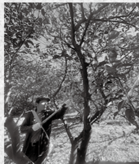
改めて、晴れの日収穫。

たにさか：春ですね～お花見しましたか?和佐の手取城址の桜は見事ですよ♪今シーズンの八朔収穫は雨の中のスタートでした。普通は雨に収穫なんて、柑橘農家の方々からお叱りをうける蛮行でしたが、和歌山市でのイベントで販売するため泣く泣く。笑 ただ他にも泣きたいことが、あの寒波のせい、見事に八朔の絨毯が広がりました。落ちたものの中から比較的新しい八朔を味見。美味いやないか!嬉しいのと悔しいのとで複雑な感情でした。今年もイベントで販売や、ポケットマルシェ、さらに吉本興業のチークーズストアで全国に向けて販売しています!売れろー!! 笑