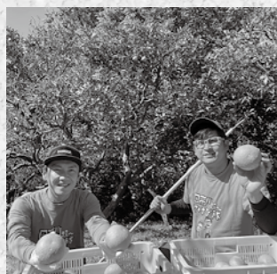
今年も収穫中です!