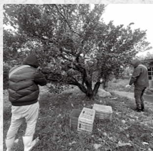
イベントで販売のため雨の中収穫しました。